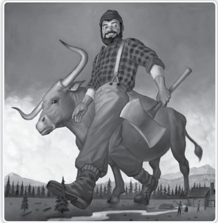
Matt Collins para Time For Kids